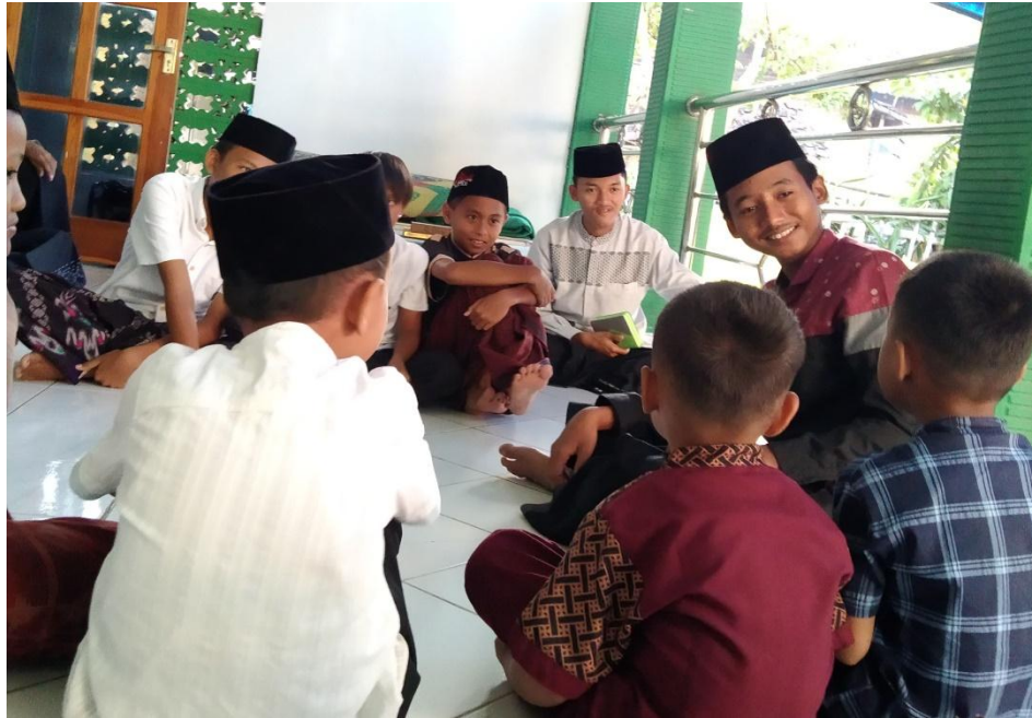
Gambar 3: Sesi Praktik “Games Edukatif Islami” untuk Anak Usia Dini