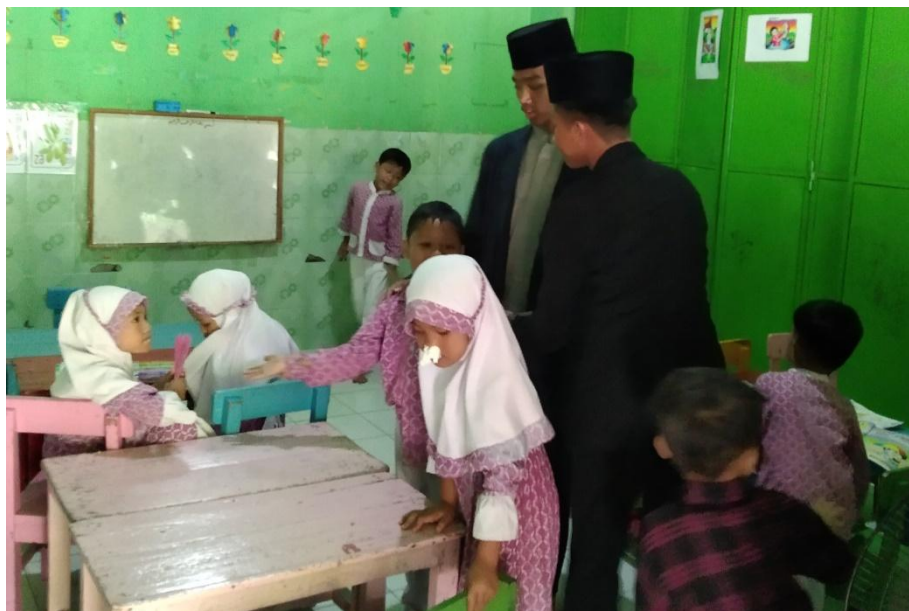
Gambar 2: Simulasi mengajar peserta menggunakan media gambar cerita

Rata-rata skor pre-test adalah 52, sementara skor post-test meningkat menjadi 87, menunjukkan adanya peningkatan signifikan pada pemahaman peserta tentang variasi metode pembelajaran anak. Hasil ini diperkuat oleh dokumentasi simulasi mengajar yang menunjukkan peserta mulai menggunakan media visual, storytelling interaktif, serta ice breaking Islami.