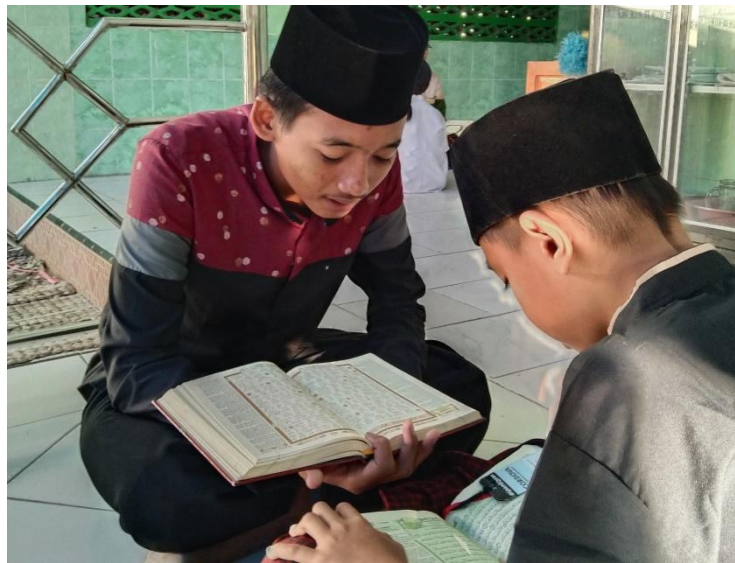
Gambar 1. Suasana Pembelajaran

Berikut dokumentasi kondisi lokasi pengabdian masyarakat di TPA Al-Barokah, Desa Tengger: